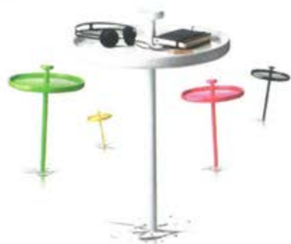
MENU: PINTABLE, HANNOU: PORTABLE HOUTEN PRIJKER, BLAD Ø 40 CM.