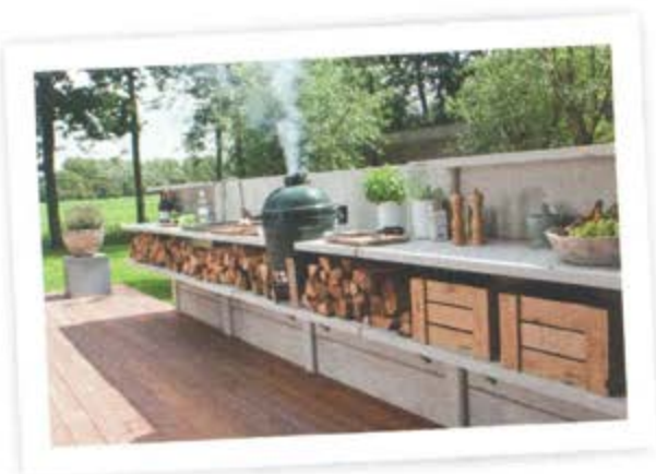
WVDO: BUITENKEUKEN, ONTWERP PIET-JAN VAN DEN KOMMER. BETONNEN STANDAARDSCHUTTING GREET UIT TOT MÓDULAIRE KOOKWERKPLAATS. HOOGTE 130 OF 200 CM, BRUIS OF ANTRACIET. EYECATCHER: DE BIG GREEN EGG BBQ.