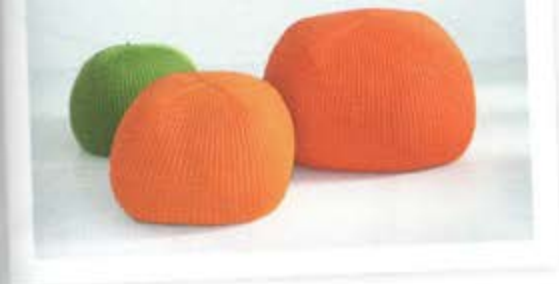
CASALIS: BONNET OUTDOOR COLLECTIE. POEFJES VOOR ERVEN.