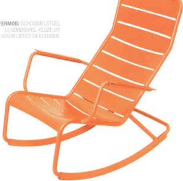
FERMOB: SCHIMMELSTOEL LUXEMBOURG. KEUZE UIT MAAR LIEFST 24 KLEUREN.