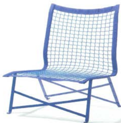
RICHARD LAMPERT: TE-BREAK, DESIGN BERT JAN POT. MATCH: ZITTING UIT TENNISNET.